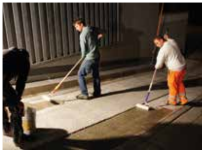
Après préparation minutieuse, le support a été enduit avec le primaire Wecryl 276.