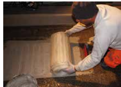
Les éléments chauffants Etherma/Systec ont été directement posés dans l'enduit pâteux Wecryl 810.