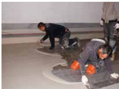
Application de Wecryl 233 Mortier autolissant.