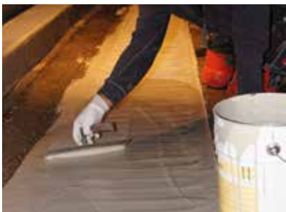
Le système de chauffage a été recouvert de mortier Wecryl 242 qui a également permis de réparer les fractures dans le revêtement.