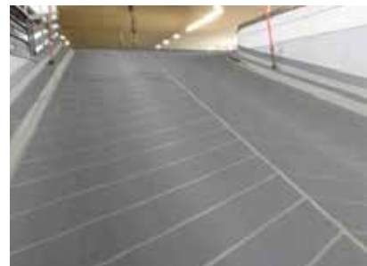
Le revêtement à relief Wecryl 410 résiste à l'abrasion et protège la structure des infiltrations de chlorures tout en assurant une sécurité maximale pour les véhicules et les piétons.