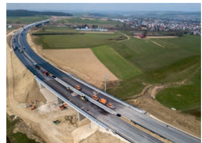
Die beiden Teilbauwerke der gekrümmten Schettelbachbrücke überführen den Schettelbach und einen Feldweg.