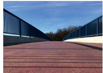
Die zweite Lage der reaktiven Versiegelung wurde mit ca. 0,6 kg/m 2 appliziert, danach war der Versiegelungsaufbau fertiggestellt.