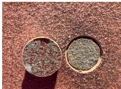
Vor der Applikation der Polymerbitumen-Schweißbahn wurde die Abreißfestigkeit der Versiegelungen geprüft.