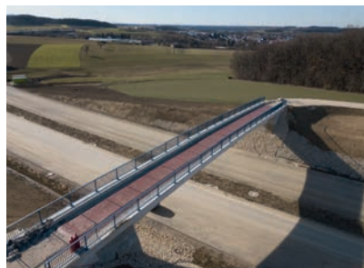
Bauwerk 9 überführt mit rund 200 m 2 Brückenfläche im östlichen Bereich einen Wirtschaftsweg über die B 29.