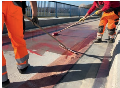
Die erste Lage der Versiegelung Wecryl 123 wurde per Gummischieber verteilt, mit der Fellrolle nachgewalzt und mit Quarzsand abgestreut.