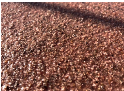
Die Oberfläche wurde porenfrei verschlossen, der Quarzsand mit Harz überdeckt – so wird eine spätere Blasenbildung im Asphalt vermieden.