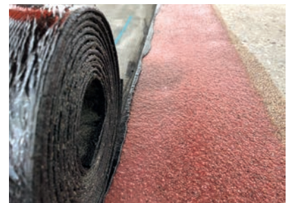
Wird die Polymerbitumen-Schweißbahn fachgerecht appliziert, tritt beim Aufschweißen eine kleine Bitumenwulst hervor.