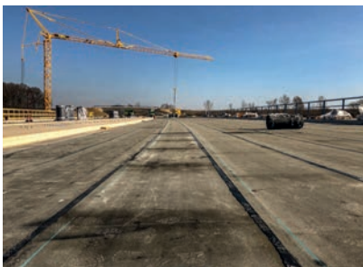
Auf die vollständig verlegte Polymerbitumen-Schweißbahn wurden zwei Lagen Gussasphalt aufgebracht.