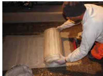
Les éléments chauffants Etherma/Systec ont été directement posés dans l'enduit pâteux Wecryl 810.